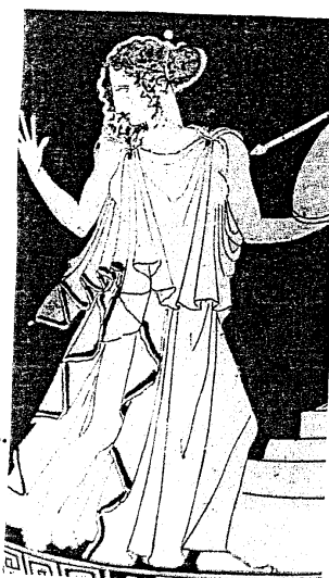
Η ωραία Ελένη. Από αρχαίο ελληνικό αγγείο.

Ήθελε να πάω με τον Πάριh στην Τροία. Έζησα μαζί του ως το θάνατό του. Μετά από την πτώση της Τροίας ακολούθησα το Μενέλαο στην Σπάρτη. Οκτώ χρόνια κράτησε το ταξίδι της επιστροφής μας. Μετά το θάνατό μου ο πατέρας μου ο Δίας με έκανε αστέρι.