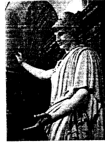
Θεά Αθηνά. Ρωμαϊκό έργο του 1ου αιώνα μ.Χ.. Μουσείο του Λούβρου

Πήγαμε στο βράχο της Ακρόπολης και αποφασίσαμε ότι όποιος προσφέρει το πιο πολύτιμο δώρο θα την αποκτούσε. Ο Ποσειδώνας χτύπησε με την τρίαινά του και αμέσως πετάχτηκε αλμυρό νερό κι ένα πολεμικό άλογο. Ο λαός θαύμασε αλλά αποφάσισε πως δεν του ήταν πολύ χρήσιμα αυτά. Το δικό μου δώρο ήταν μια ελιά που αμέσως ψήλωσε και έδωσε καρπούς. Έτσι κέρδισα και έγινα προστάτιδα της πόλης που ονομάστηκε Αθήνα.