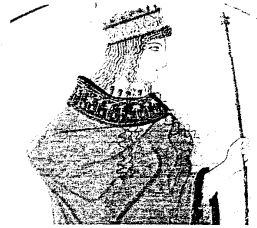
• Η Ήρα

Εγώ είμαι η Ήρα μία από τις Ολύμπιες θεότητες, ανήκω στον κύκλο των δώδεκα Θεών. Είμαι κόρη του Κρόνου και της Ρέας, αδερφή του Δία, της Δήμητρας, του Ποσειδώνα, του Άδη και της Εστίας. Εγώ για πολλά χρόνια είχα σχέση με τον Δία και έτσι έγινα γυναίκα του. Αποκτήσαμε αργότερα τον Άρη, την Ήβη και την Ειλείθυια. Παιδί μου ήταν και ο Ήφαιστος που μετά τη γέννησή του τον πέταξα στη θάλασσα όπου τον έσωσαν η Θέτιδα και η Ευρυνόμη και τον μεγάλωσαν. Αργότερα εκείνος για να με εκδικηθεί κατασκεύασε ένα θρόνο και όταν κάθισα επάνω αιχμαλωτίστηκα και δεν μπορούσα να λυθώ. Τελικά τον έπεισαν οι Θεοί να με λύσει και θα του έδιναν για αντάλλαγμα την πιο όμορφη από τις Θεές.